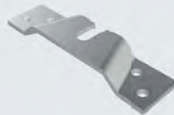
Tragflansch 8069, 2 Stück