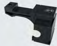
Haltestopper SX 100H, 2 Stück