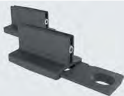
Bodenführung T-Guide Holz