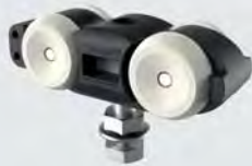
Laufwagen RX100A, 2 Stück

Das Komplett-Set als moderne Einstiegsvariante für alle Tür- und Schiebeelemente aus Holz. Vollständig ausgestattet mit allen benötigten Bauteilen ist dieses Set der Türöffner in unser Premiumsegment.