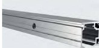
Laufschiene T365, 2250 mm